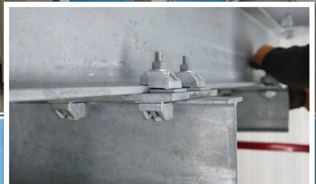
Die Träger wurden mit Trägerklemmen Typ AF montiert

Aufgrund wachsender Nachfrage beauftragte Nor Tekstil den Bau einer neuen, hochmodernen Wäscherei in Skedsmo nördlich von Oslo. Die Anlage sollte als größte ihrer Art in Norwegen hocheffizient ausgelegt werden. Das Projekt umfasste unter anderem nicht tragende Stahlkonstruktionen unter dem Tragwerk des Dachs zum hängenden Transport von Textilien in der Anlage. Hierfür war eine entsprechend belastbare Verbindungslösung erforderlich.